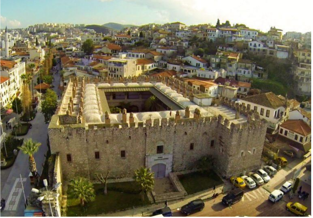
Görsel: ÖKÜZ MEHMET PAŞA KERVANSARAYI