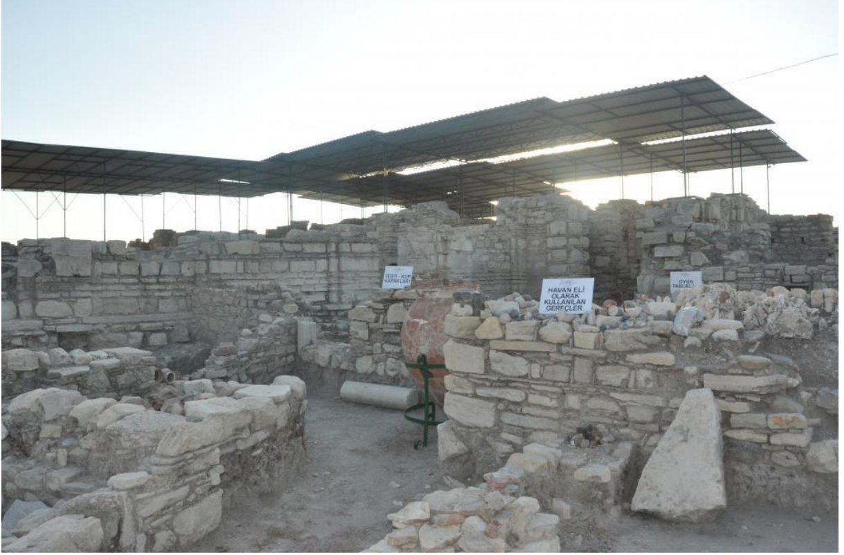
Görsel: Anaia (Kadıkalesi)