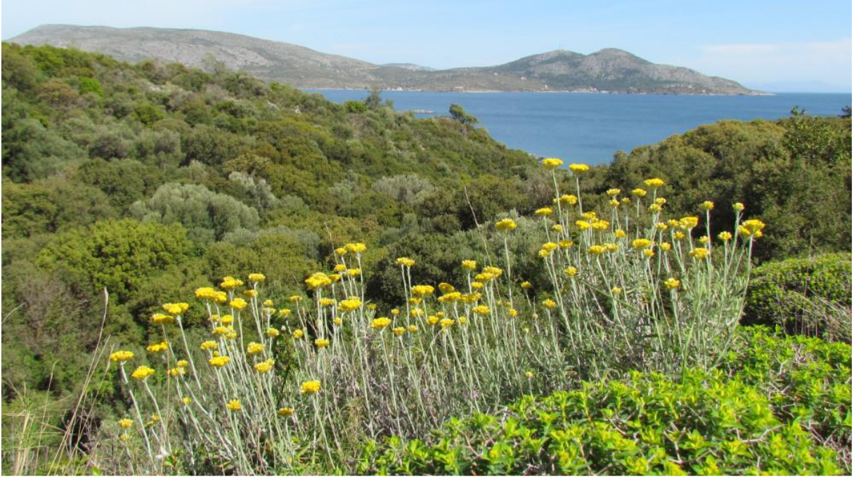
Görsel: Aydın Ölmez Çiçeği