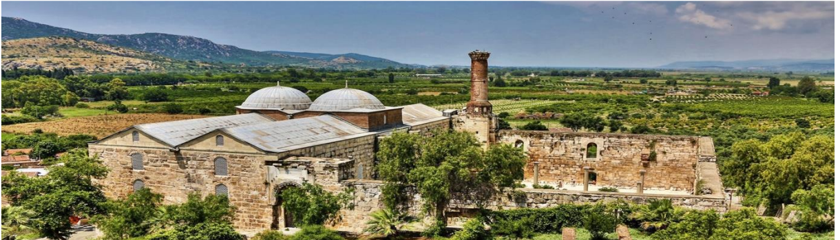
Görsel: İsabey Camii

1375 yılında Aydınoğlu İsabey tarafından Mimar Ali'ye inşa ettirilmiştir. 51x57 m. ölçülerindeki bu camide Efes'le Artemis Tapınağı'ndan getirilen mimari parçalar, özellikle sütunlar kullanılmıştır. Kubbenin pandantifleri çini levhalarla, pencere pervazları stelaktit, örgü motifleri ve renkli taşlarla süslenmiştir. Mihrap ve minber mermerden yapılmıştır. Bunlardan başka Selçuk içinde halen kullanılan dört mescit ve birçok yıkık ve onarılmış mescit ve kümbet yer almaktadır. Bu eserler Aydınoğulları ve Osmanlı dönemine tarihlenir