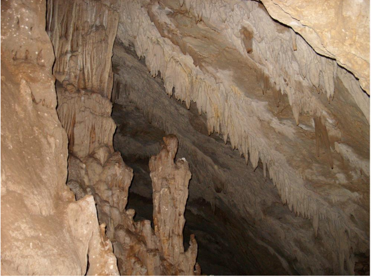
Görsel: Aslanlı Mağarası Kurşunlu Manastırı

Kuşadası Davutlar Mahallesi'nden yaklaşık 12 km uzaklıkta ve 600 metre yükseklikte Dilek Yarımadası Milli Parkı sınırlarındaki orman alanı içinde yer alan Kurşunlu Manastırı, bir Bizans yapılar topluluğudur ve harika bir manzaraya sahiptir.