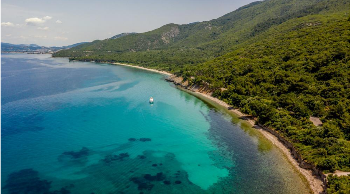
Görsel: Dilek Yarımadası

209 kuş türü görülmektedir. Bölge aynı zamanda nesli tehlike altında olan Tepeli Pelikan'ın en önemli kuluçkalama alanlarından biridir. Bunun yanı sıra yine dünya çapında nesli tehlike altında olan Cüce Karabatak da burada barınmaktadır. Benzersiz biyolojik çeşitliliği nedeniyle Dilek Yarımadası aynı zamanda, Avrupa Konseyi tarafından "Flora Biyogenetik Rezerv Alanı" olarak kabul edilmiştir. Doğanın tüm renklerinin denizin kristal sularıyla buluştuğu, balıkların yüzerken size eşlik ettiği ve rengarenk fauna ortamına karşı ruhunuzun dinleneceği bu muhteşem doğa harikasını mutlaka görmeniz ve yaşamamız gerekmektedir.