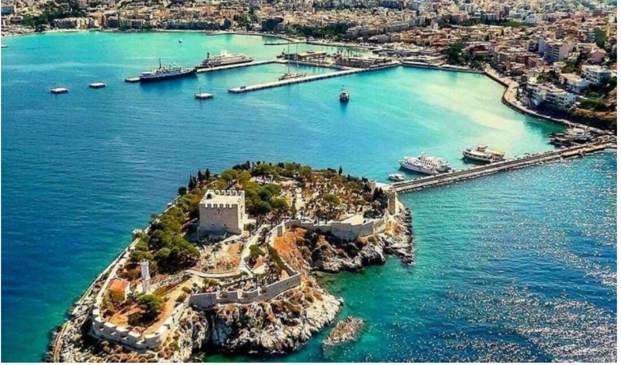
Görsel: Kuşadası Fotoğrafi 1

Kuşadası; Aydın'ın orta ölçekli bir ilçesi olmasına rağmen dünya standartlarındaki konaklama tesisleri, doğa ile tarihi ile tatili, deniz ile nefis lezzetleri buluşturan eşsiz atmosferi sayesinde hayallerinizdeki tatili gerçeğe dönüştüren turizm merkezlerinden biridir. Aydın'a yaklaşık 65 ve İzmir'e 112 kilometre mesafede bulunan Kuşadası, tarihi ve doğal güzelliklerini gözler önüne seren yapılarıyla her geçen gün daha da dikkat çekmektedir