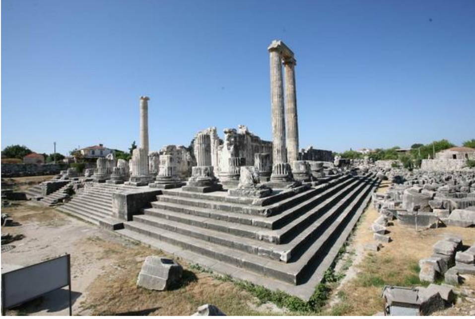
Görsel: Apollo Tapınağı