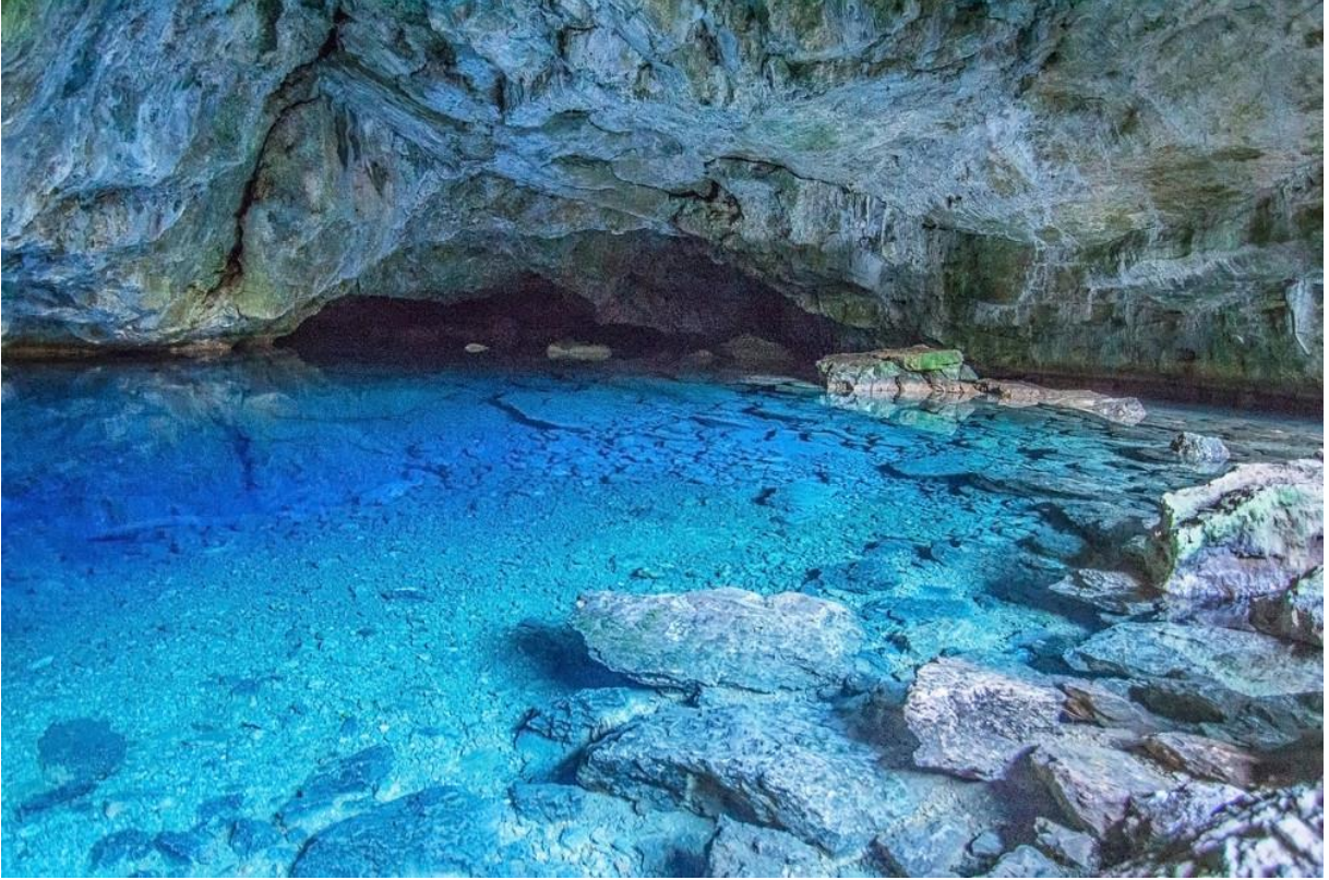
Görsel: Zeus Mağarası